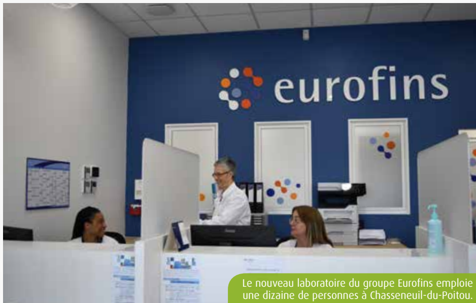
Le nouveau laboratoire du groupe Eurofins emploie une dizaine de personnes à Chasseneuil-du-Poitou.

A l'extérieur comme à l'intérieur, le code couleur est bleu et orange. Aucun doute, vous êtes dans un laboratoire du groupe Eurofins. Conforme aux autres établissements du groupe leader d'analyses médicales spécialisées, celui de Chasseneuil-du-Poitou emploie une dizaine de salariés (secrétaires, infirmiers, biologistes et techniciens). Il propose les services classiques d'un laboratoire d'analyses médicales, mais pas