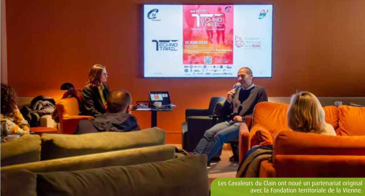
Les Cavaleurs du Clain ont noué un partenariat original avec la Fondation territoriale de la Vienne.

Au-delà de la course de 12km et de la marche de 9,5km, la première édition du Techno Trail du Futuroscope, organisée le 13 juin, propose aussi un challenge entreprises et une épreuve solidaire.