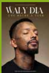
Programme complet sur futuroscopecongres.com .

Le Festival des arts à l'école (lire p. 14) n'est pas le seul rendez-vous programmé en ce mois d'avril au Palais des congrès du Futuroscope. Ce dernier accueillera samedi à 20h30 un quatuor de musiciens passionnés, le Grissini Project, qui interprétera les plus belles musiques d'animation d'Hayao Miyazaki : Le Voyage de Chihiro , Mon Voisin Totoro , Le Château ambulatoire , Princesse Mononoké , Le Vent se lève , Kiki la petite sorcière , Ponyo sur la falaise ... Le 11 avril, à 20h30, ce sera au tour de Waly Dia d'investir la scène pour Une Heure à tuer . « Accordez-moi une heure, je me charge du reste », prévient l'humoriste. Côté humour, Marie s'infiltrer est au programme également le 19 avril, à 20h30, avec Culot , un spectacle hybride qui mêle sketch et comédie musicale, impro et textes littéraires, et invite le public à sortir de sa zone de confort. Entre temps, le 12 avril, à 20h, Pasion de Buena Vista aura enflammé le lieu avec des musiques qui transportent au cœur des nuits cubaines et une performance scénique unique. Dans un tout autre style, le Hip Hop International France (HHI), compétition de danse hip hop chorégraphique rassemblant des passionnés de danse de toute la France, débarquera le 26 avril, à 15h.