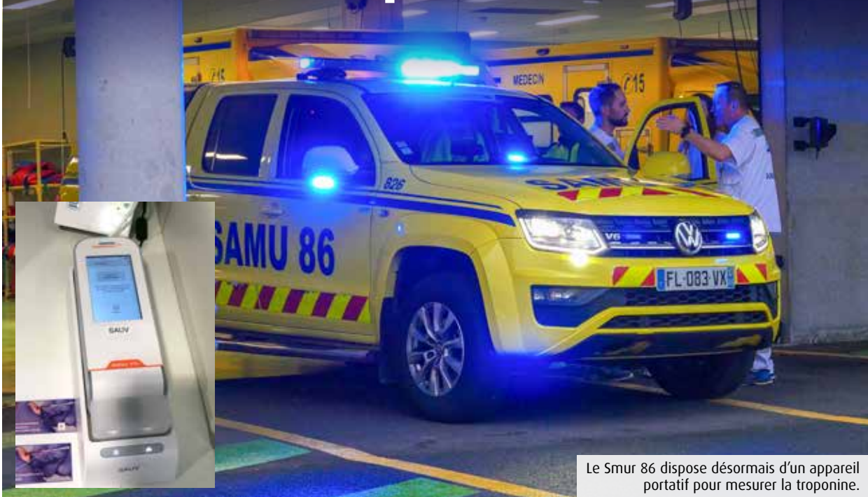
Le Smur 86 dispose désormais d'un appareil portatif pour mesurer la troponine.

Les urgentistes du Smur de Poitiers ont développé un test rapide qui permet de détecter les risques d'infarctus du myocarde directement sur le lieu de l'intervention.