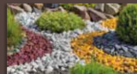
Gravier décoratif pour vos habillages et décors extérieurs