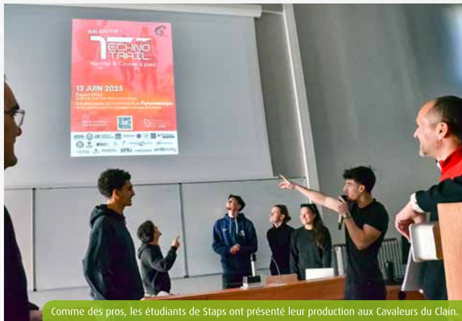
Comme des pros, les étudiants de Staps ont présenté leur production aux Cavaleurs du Clain.