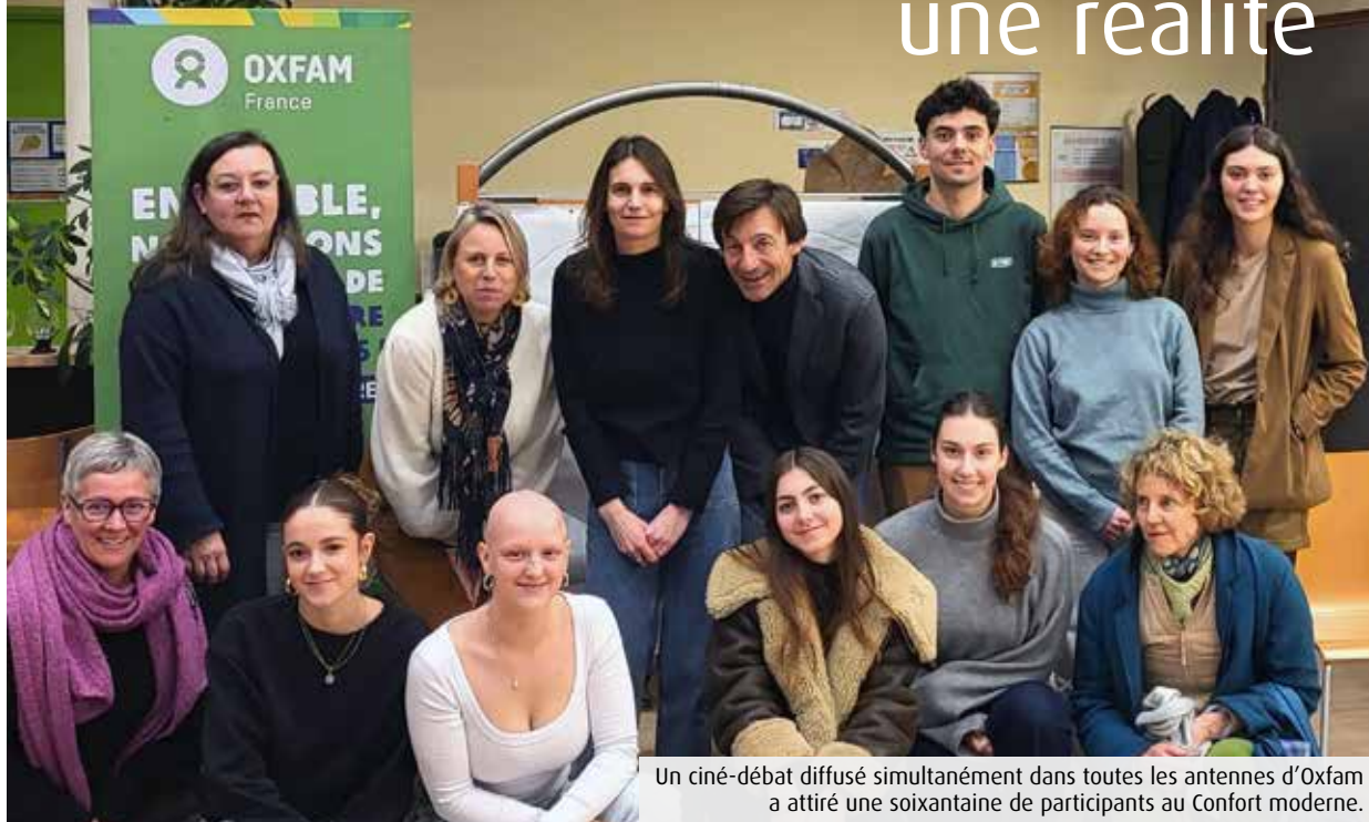
Un ciné-débat diffusé simultanément dans toutes les antennes d'Oxfam a attiré une soixantaine de participants au Confort moderne.

Déjà présente dans dix-sept villes françaises, l'ONG Oxfam étend son maillage territorial en s'implantant à Poitiers. Une initiative portée par des bénévoles locaux, déterminés à agir en faveur de la solidarité et de la justice sociale.