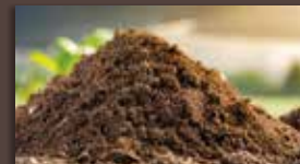
Matériaux de carrières Sable - Graviers - Calcaires - Terre végétale