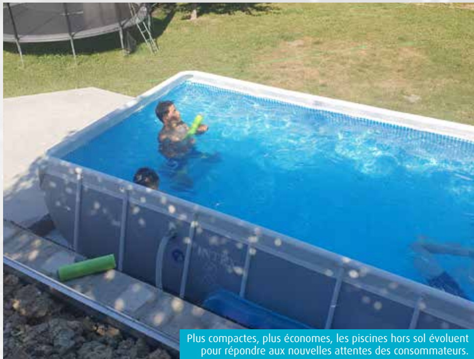
Plus compactes, plus économes, les piscines hors sol évoluent pour répondre aux nouvelles attentes des consommateurs.

Comme dans de nombreux secteurs, la vague Covid a déferlé sur le marché de la piscine hors sol. Mais contrairement à d'autres, ce secteur a su tirer profit des confinements et de l'isolement des Français. Selon la Fédération des professionnels de la piscine et du spa (FPP), le chiffre d'affaires du secteur a bondi de 32% entre 2020 et 2021. Un boom spectaculaire qui a cependant laissé des traces. « Toutes les grandes surfaces ont massivement surstocké durant les années Covid et post-Covid, anticipant une demande prolongée des par-