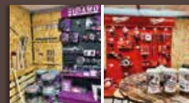
Pour vos travaux une large gamme de consommables et outillage