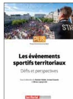
Les Événements sportifs territoriaux Presses universitaires du sport 91 p. - Paru le 24 janvier 2025 - 45€.