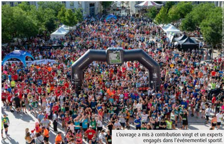
L'ouvrage a mis à contribution vingt et un experts engagés dans l'événementiel sportif.