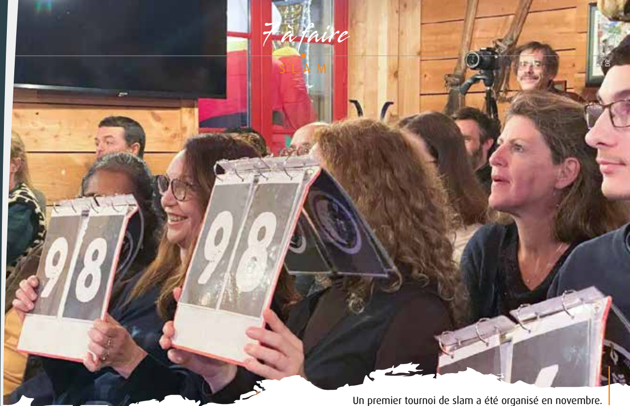
Un premier tournoi de slam a été organisé en novembre.