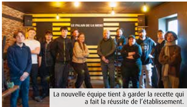
La nouvelle équipe tient à garder la recette qui a fait la réussite de l'établissement.

Mercredi 12 février. A vingt-quatre heures de l'ouverture, l'équipe d'une dizaine de salariés s'affaire aux derniers préparatifs. Cuisiniers, barmans, chacun met du cœur à l'ouvrage dans une ambiance décontractée et familiale, à l'image du Palais de la bière (PLB). Ce pilier de la vie culturelle poitevine, situé rue du Faubourg-du-Pont-Neuf a marqué bon nombre de Poitevins et d'étudiants de passage avant sa fermeture fin 2023. « Nous n'avions pas prévu de reprendre un commerce ni de gérer un établissement. C'était impossible de voir disparaître ce lieu chargé de