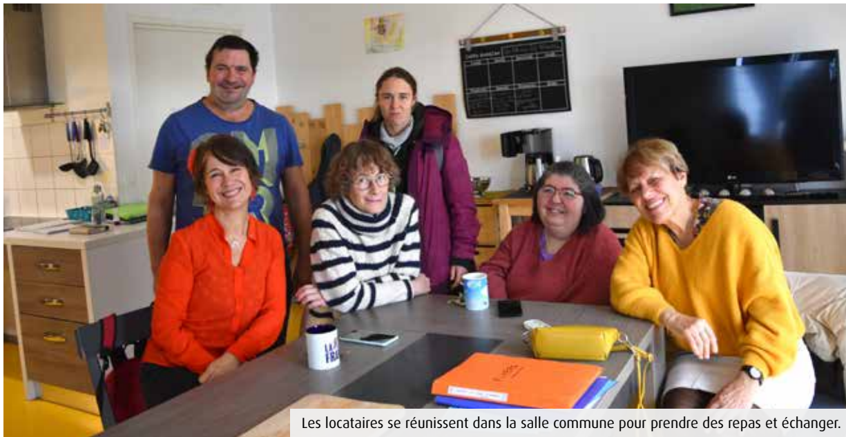
Les locataires se réunissent dans la salle commune pour prendre des repas et échanger.

La 3 e édition du Rallye des aventures solidaires; 100% RAS, s'est déroulée à la mi-octobre, dans le désert marocain. Seize équipages y ont participé, ce qui a permis aux organisateurs de récolter 20 000€ au profit de deux structures: 14 000€ pour le Fonds Aliénor du CHU de Poitiers et 6 000€ en faveur de la Fondation marocaine Lalla Salma, qui soutient les familles touchées par un cancer. Depuis le début, l'épreuve pilotée par Yves Tartarin a reversé 44 800€.