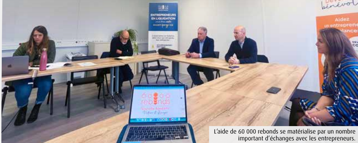
L'aide de 60 000 rebonds se matérialise par un nombre important d'échanges avec les entrepreneurs.