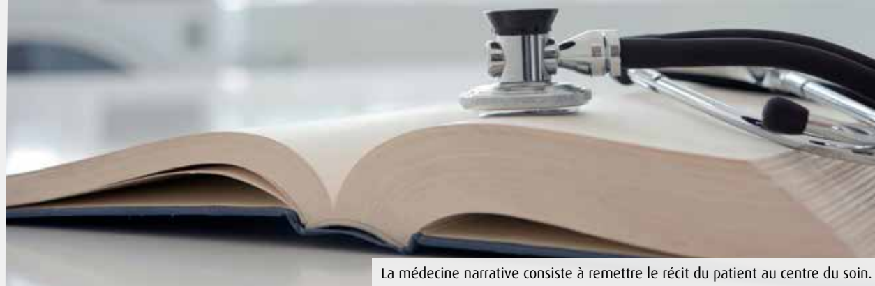
La médecine narrative consiste à remettre le récit du patient au centre du soin.

Cette page est réalisée en partenariat avec l'Espace Mendès-France. Programme complet et tarifs sur emf.fr