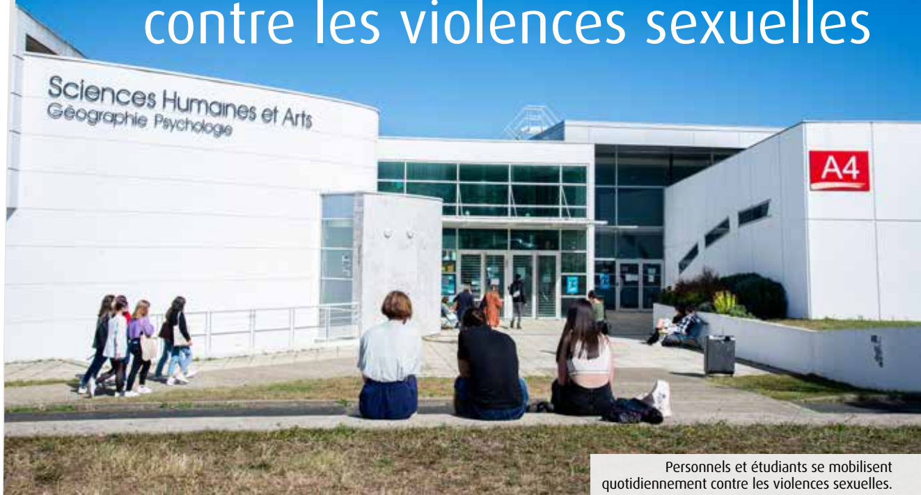
Personnels et étudiants se mobilisent quotidiennement contre les violences sexuelles.