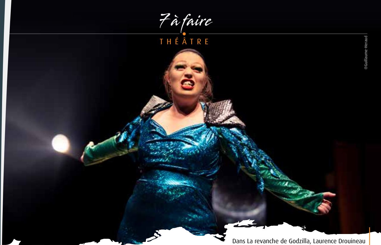
Dans La revanche de Godzilla, Laurence Drouineau a mis une partie de son histoire.

• Jusqu'au 25 janvier , A la recherche du Petit Prince, sur les traces d'Antoine de Saint-Exupéry, à la médiathèque François-Mitterrand, à Poitiers.