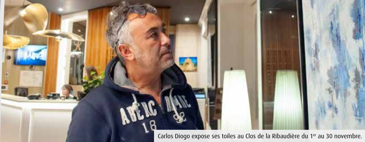
Carlos Diogo expose ses toiles au Clos de la Ribaudière du 1 er au 30 novembre.

Dans ses tableaux, Carlos Diogo explore et mélange les styles, passant avec aisance de l'art abstrait au pop art. L'artiste se nourrit d'influences populaires et de matériaux peu conventionnels. Il expose actuellement à Chasseneuil-du-Poitou.