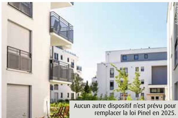
Aucun autre dispositif n'est prévu pour remplacer la loi Pinel en 2025.

Le dispositif d'investissement locatif Pinel, du nom de l'ancienne ministre du Logement Sylvia Pinel, vit ses dernières heures. Mis en place le 1 er septembre 2015, le dispositif permettait aux acquéreurs de bénéficier d'une réduction d'impôts sur l'achat d'un logement neuf destiné à la location. Entre 2014 et 2020, le nombre de logements construits sous l'impulsion de cette loi varie selon les estimations, allant de 42 522 à... 550 000. La Cour des comptes retient le chiffre de 243 931 habitations. Présenté comme le pilier de l'investissement locatif en France, Pinel a su séduire par sa simplicité. « A ses débuts, ce