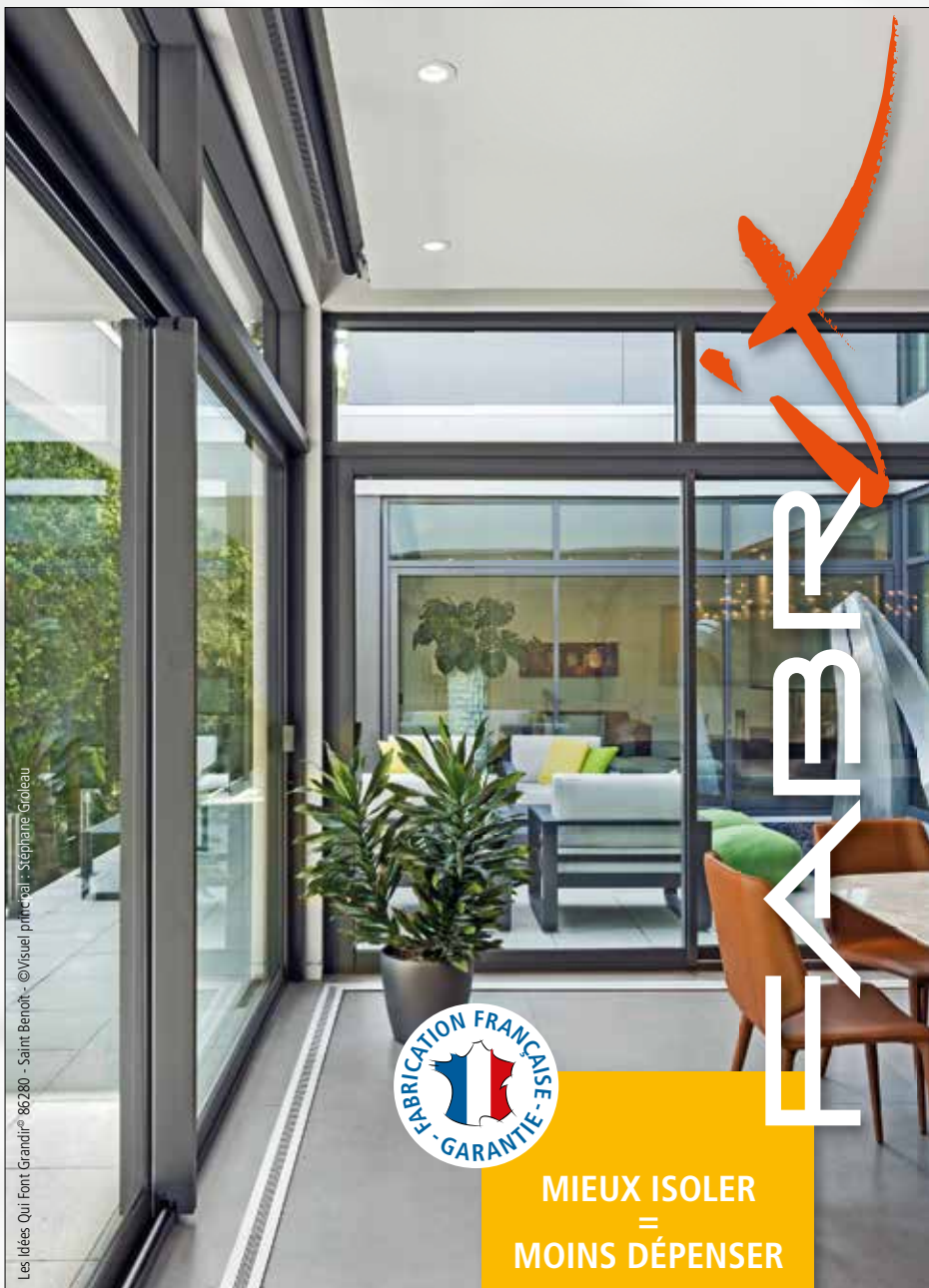
Les idées Qui Font Grandir