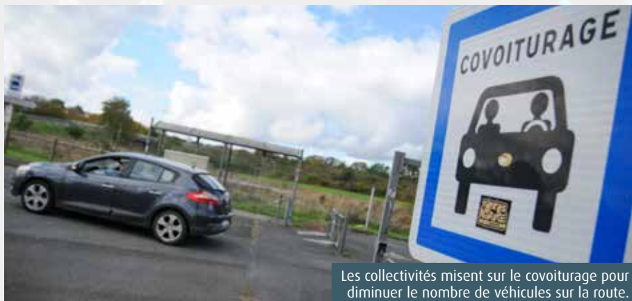
Les collectivités misent sur le covoiturage pour diminuer le nombre de véhicules sur la route.

En France, il recule, mais à Poitiers il ne faiblit pas. Le covoiturage connaît une baisse significative du nombre de trajets dans l'Hexagone. D'après l'étude réalisée par Vinci Autoroutes (1) , 83,8% des conducteurs roulaient seuls dans leurs véhicules contre 85,7% en 2024. Seules quelques agglomérations contredisent cette tendance : Bordeaux, Toulon et donc Poitiers. La ville aux cent clochers est la championne du covoiturage avec 26,6% des automobilistes convaincus. Plusieurs facteurs tendent à expliquer ce phénomène. « Il y a une prise de conscience collective qui incite les riverains à passer à des modes de déplacements