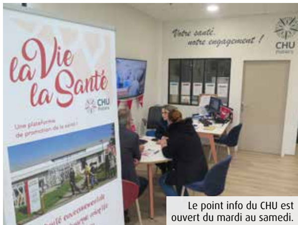
Le point info du CHU est ouvert du mardi au samedi.

Depuis un an, le centre commercial Autoshopping Poitiers-Sud abrite un local pas comme les autres. Ici ni prêt-à-porter, ni objets de déco ou vitrines gourmandes. Ces 37m 2 situés au niveau de la porte Val de Vienne sont occupés par... le CHU. La direction de la galerie marchande voulait diversifier son offre, l'établissement de santé cherchait à développer la sienne hors les murs en direction de ses usagers mais aussi du grand