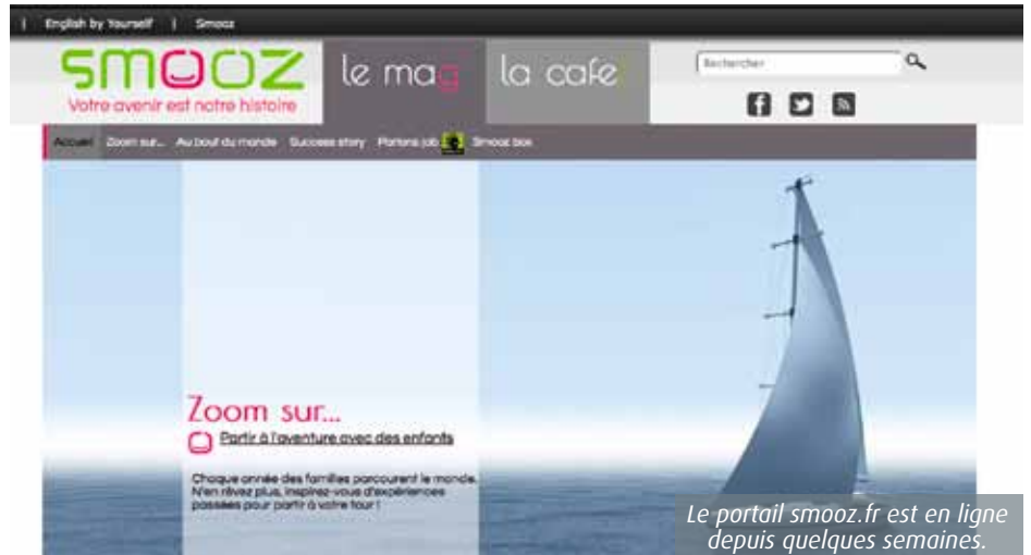
Le portail smooz.fr est en ligne depuis quelques semaines.

Évidemment, la seule mise en lumière de ces témoignages n'aurait aucun sens à l'heure de l'interactivité. Alors, le Cned a découpé le portail en deux