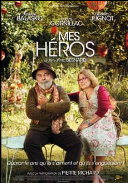
Comédie d'Eric Besnard avec Josiane Balasko, Gérard Jugnot, Clovis Cornillac (1h27).