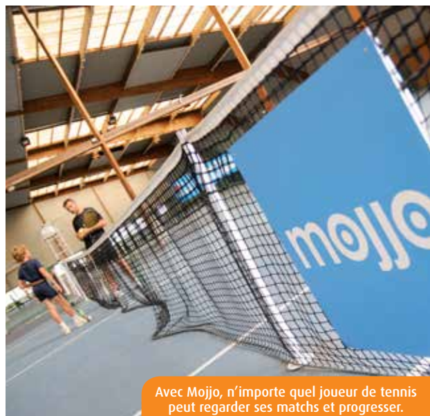
Avec Mojjo, n'importe quel joueur de tennis peut regarder ses matchs et progresser.

Le Tennis Club du Valvert vient d'investir dans un outil baptisé Mojjo, qui filme et analyse les séquences d'entraînement ou les matchs. Une première dans le Grand Ouest, qui convient aussi bien aux débutants qu'aux joueurs en quête du coup parfait.