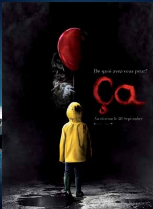
Film d'épouvante D'Andy Muschietti avec Bill Skarsgård, Jaeden Lieberher, Finn Wolfhard (2h15).

► Florie Doublet - fdoulet@7apoitiers.fr