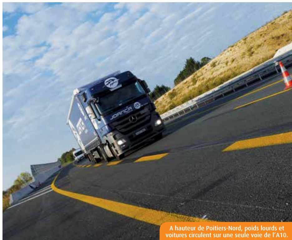
A hauteur de Poitiers-Nord, poids lourds et voitures circulent sur une seule voie de l'A10.

Afin de « s'adapter aux évolutions du trafic » et « d'améliorer les conditions de circulation », le concessionnaire de la voie rapide a engagé 61M€ dans son projet de « minéralisation » du terre-plein central. Entamés cette année entre Sainte-Maure-de-Touraine et Poitiers-Sud, les travaux devraient durer jusqu'en 2019. « La sécurité des usagers est notre priorité, explique Sylvie Marty, responsable de la communication de Vinci Autoroutes. Le remplacement de la glissière de sécurité par un terre-plein en béton permettra d'éviter que