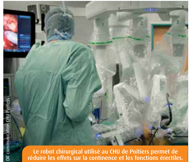
Le robot chirurgical utilisé au CHU de Poitiers permet de réduire les effets sur la continence et les fonctions érectiles.

Le CHU de Poitiers vient d'achever son « Prostate Tour », une opération d'information et de sensibilisation du grand public au cancer de la prostate. L'occasion également de rappeler les évolutions en matière de diagnostic.