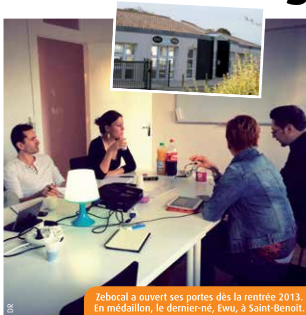
Zebocal a ouvert ses portes dès la rentrée 2013. En médaillon, le dernier-né, Ewu, à Saint-Benoît.