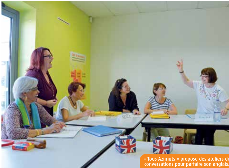
« Tous Azimuts » propose des ateliers de conversations pour parfaire son anglais.

A chaque langue sa motivation ! Jeunes ou plus âgés, des dizaines de Poitevins décident chaque année de sauter le pas. Et dans les couloirs de la Maison des projets de Buxerolles, les anecdotes sont nombreuses. « Un jour, un jeune homme d'origine polonaise est venu nous expliquer qu'il avait été adopté tout petit et qu'il avait prévu de retrouver sa première famille. Il a donc suivi nos sessions de polonais pendant un