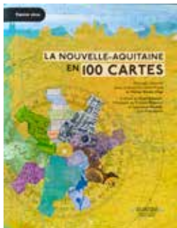
La Nouvelle-Aquitaine en 100 cartes, par Olivier Bouba-Olga - éditions Atlantique - 196 pages - 24€.

Les entreprises du secteur privé ont, elles aussi, compris l'intérêt de ces face-à-face furtifs et ciblés. Le Crédit Agricole de la Touraine et du Poitou le 13 février, l'école supérieure de la banque le 4 avril, Transdev le 6 avril... A chaque événement son lot de postes dans des secteurs d'activité très variés. Et parfois de l'immersion, comme chez Transdev, à Châtelleraut, où un simulateur de conduite était mis à disposition. Avec quels résultats ? « Trente-cinq personnes sont venues, intéressées pour en savoir plus sur le métier et l'entreprise. Dix-sept vont approfondir par un stage de découverte de quelques jours, une immersion, en vue d'entrer en formation par la suite, et treize venaient là pour affiner un projet à moyen ou long terme. En résumé, ce fut une belle réussite avec beaucoup d'échanges ! »