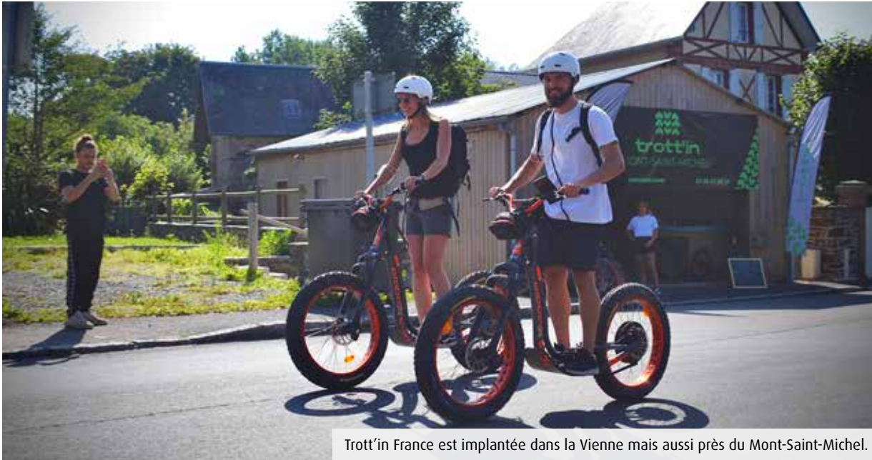
Trott'in France est implantée dans la Vienne mais aussi près du Mont-Saint-Michel.