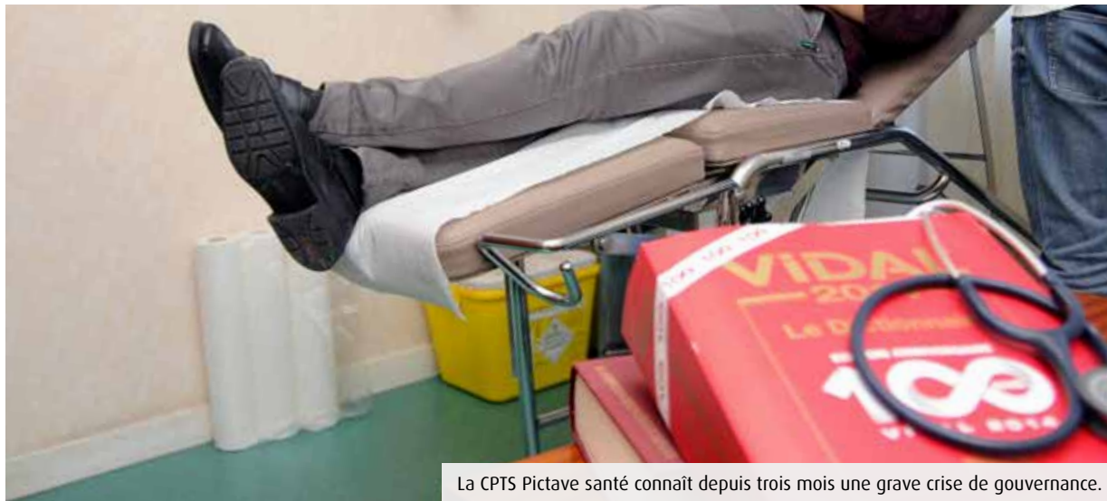
La CPTS Pictave santé connaît depuis trois mois une grave crise de gouvernance.

Le problème de gouvernance perdue depuis trois mois au sein de la CPTS Pictave santé, sous le regard impuissant de ses partenaires institutionnels et au détriment de la population dont elle est censée améliorer l'accès aux soins.