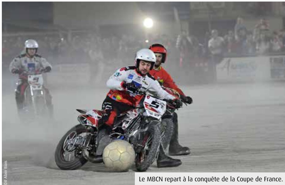
Le MBCN repart à la conquête de la Coupe de France.

Les Vauclusiens de Carpentras, le MBCN les a dominés en finale du Trophée des Champions en octobre (3-1), puis encore par deux