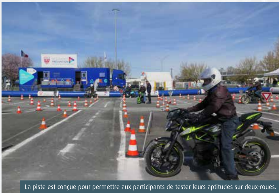
La piste est conçue pour permettre aux participants de tester leurs aptitudes sur deux-roues.

En 2023, 707 conducteurs de deux-roues motorisés ont perdu la vie sur la route, ce qui représente 22% des victimes d'accidents mortels. Or les scooters, mobylettes et autres motos ne représentent qu'1,9% du trafic routier. Cherchez l'erreur... Face à ce constat, Assurance Prévention (240 assureurs en France), s'est associée au ministère de l'Intérieur pour promouvoir une piste de sécurité routière dédiée à l'initiation au deux-roues motorisé. Le parking du centre Leclerc de Châtelleraut a ainsi accueilli début mars, pendant quatre jours, un parcours routier doté de « Stop », « Cédez-le-passage » et giratoires, à parcourir à scooter ou à moto de 50 ou 125cm 3 , thermiques ou électriques. A dire vrai, l'initiative n'est pas nouvelle. Le ministère de l'Intérieur a inauguré sa piste de prévention en... 1972. « Cette année-là, il y a eu 18 034 morts », rappelle Pascal Sanchez, le responsable adjoint de la piste. Aujourd'hui, le