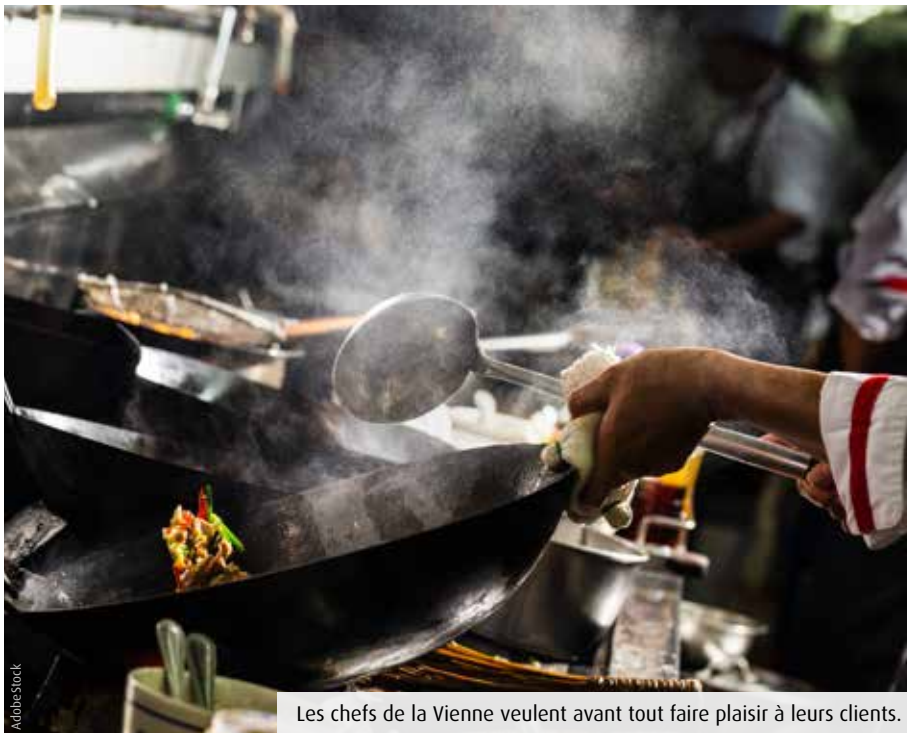
Les chefs de la Vienne veulent avant tout faire plaisir à leurs clients.