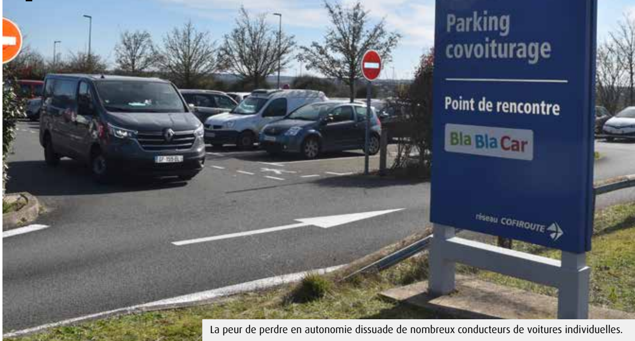
La peur de perdre en autonomie dissuade de nombreux conducteurs de voitures individuelles.

Plus économique et plus écologique, le covoiturage local reste pourtant timide dans la Vienne. Grand Poitiers et Grand Châtelleraut relèvent le défi en proposant une subvention pour relancer l'usage.