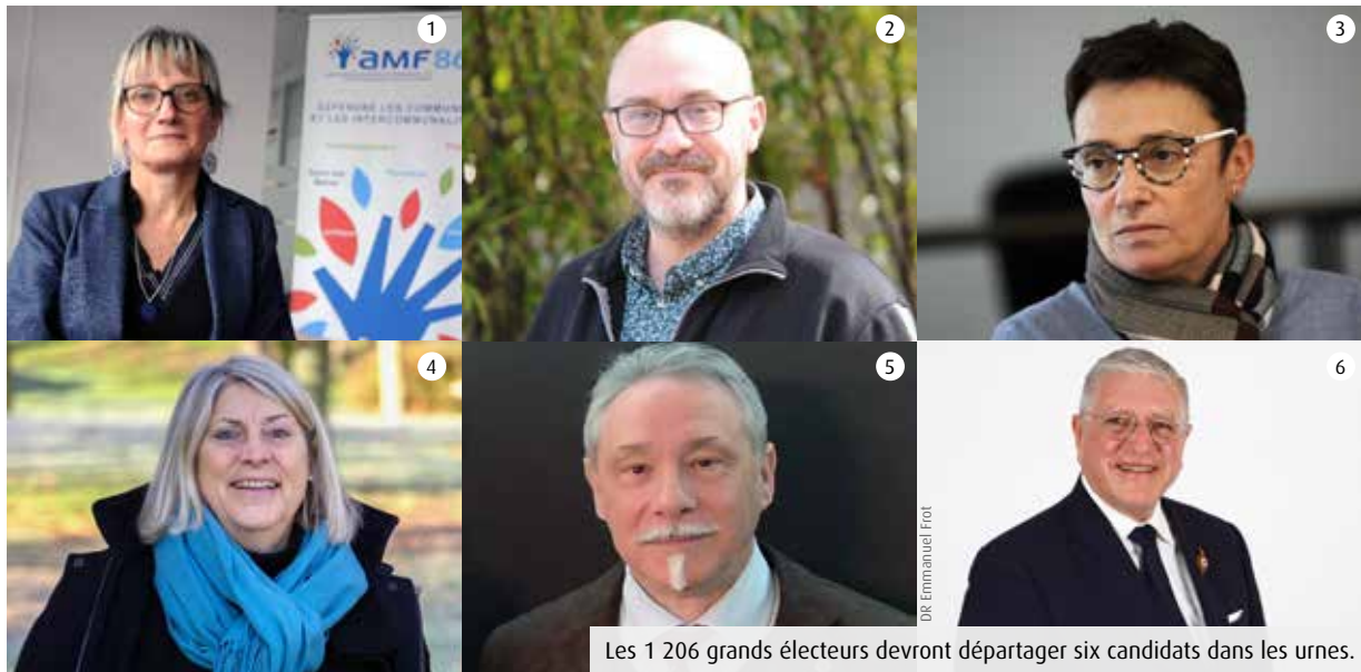
Les 1 206 grands électeurs devront départager six candidats dans les urnes.

La succession d'Yves Bouloux au poste de sénateur de la Vienne se joue dimanche en préfecture. Seuls les grands électeurs sont amenés à voter pour l'un des six candidats en lice. Les enjeux.