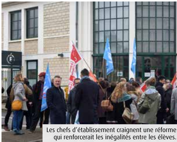
Les chefs d'établissement craignent une réforme qui renforcerait les inégalités entre les élèves.