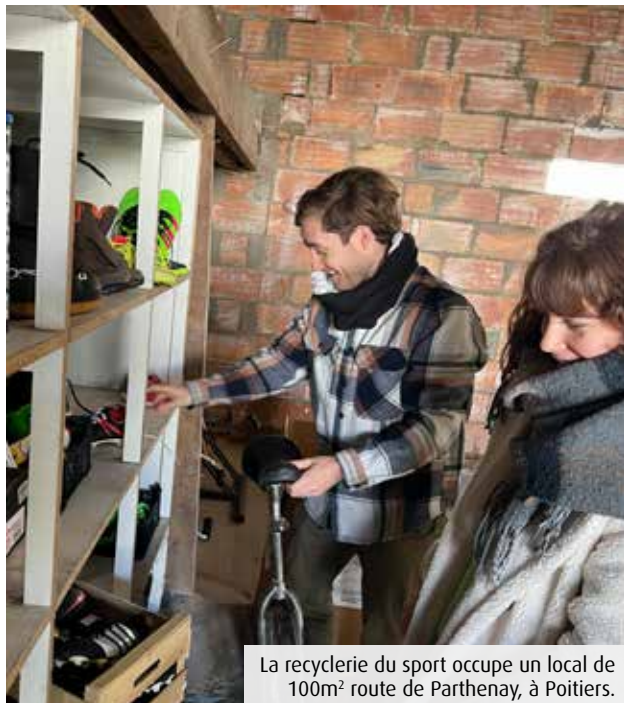
La recyclerie du sport occupe un local de 100m 2 route de Parthenay, à Poitiers.

L'association Sauve ton sport vient d'ouvrir la première recyclerie du sport, à Poitiers-Ouest. Objectif : remettre dans le circuit des vêtements et équipements qui dorment dans les armoires et les gymnases.