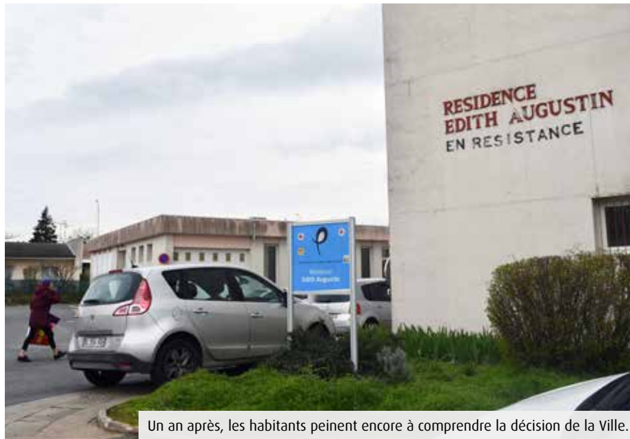
Un an après, les habitants peinent encore à comprendre la décision de la Ville.