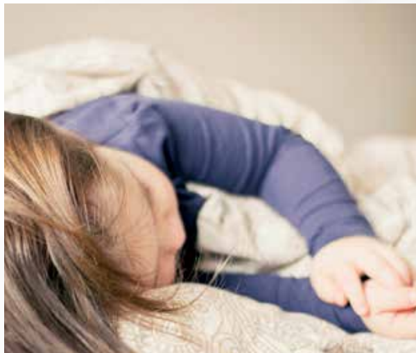
Les troubles du sommeil concernent toutes les tranches d'âge.