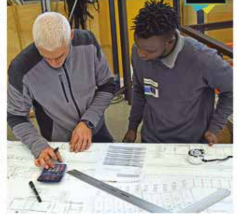
Les Idées Qui Font Grandir - 86280 - Saint-Benoît

La transmission des savoir-faire traditionnels se doit de répondre aux exigences novatrices. Forte de ces déterminations, c'est bien dans cette perspective que FABRIX contribue au rayonnement de son territoire, mais aussi à son attractivité économique et culturelle.