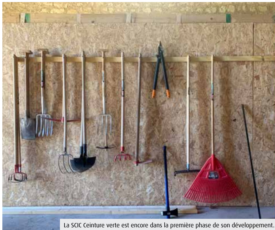
La SIC Ceinture verte est encore dans la première phase de son développement.

Sous le feu des projecteurs en raison de l'actualité judiciaire, la SIC Ceinture verte Grand Poitiers reste un projet développement agricole... et économique dont la maturité est encore en jachère.