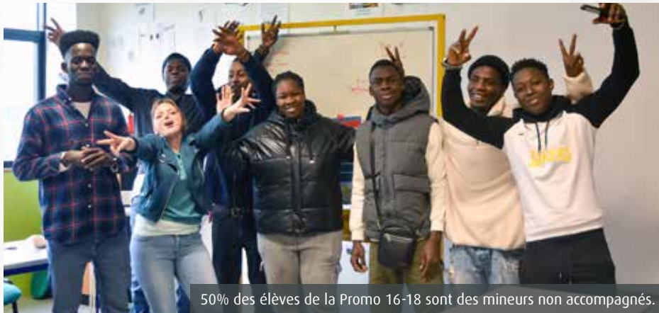
50% des élèves de la Promo 16-18 sont des mineurs non accompagnés.

« En six mois, devenez un ouvrier qualifié... Ou découvrez l'univers de l'alternance et de l'apprentissage. Depuis 2020, l'Afpa propose aux adolescents de 16 à 18 ans d'intégrer la Promo 16-18 pour les aider à trouver leur voie professionnelle et lutte ainsi contre le décrochage scolaire (Le 7 n°514). Ce dispositif permet également aux mineurs non accompagnés (MNA) de s'en sortir grâce à l'emploi. Ils représentent une part importante des effectifs, comme à Chasseneuil-du-Poi-