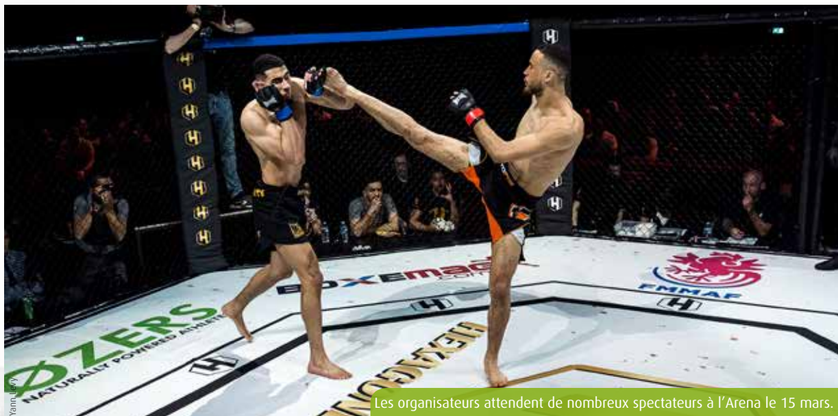
Les organisateurs attendent de nombreux spectateurs à l'Arena le 15 mars.

Fort du succès auprès des Poitevins l'an dernier, l'événement de la ligue européenne Hexagone MMA revient le 15 mars à l'Arena Futuroscope.