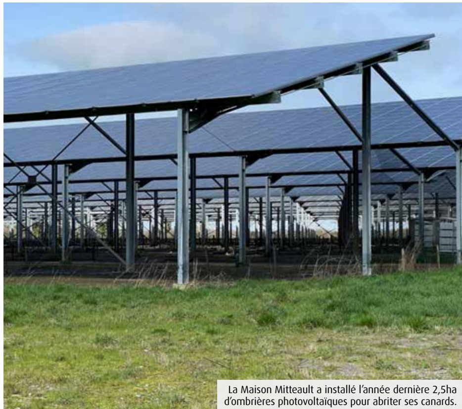
La Maison Mitteault a installé l'année dernière 2,5ha d'ombrières photovoltaïques pour abriter ses canards.

Dans la Vienne, près d'une trentaine de projets d'agrivoltaïsme seraient actuellement à l'étude et six déjà autorisés. Un décret est attendu pour encadrer le développement de ce nouveau modèle mêlant production agricole et d'énergie solaire.