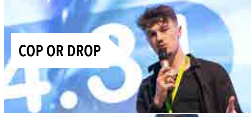
COP OR DROP