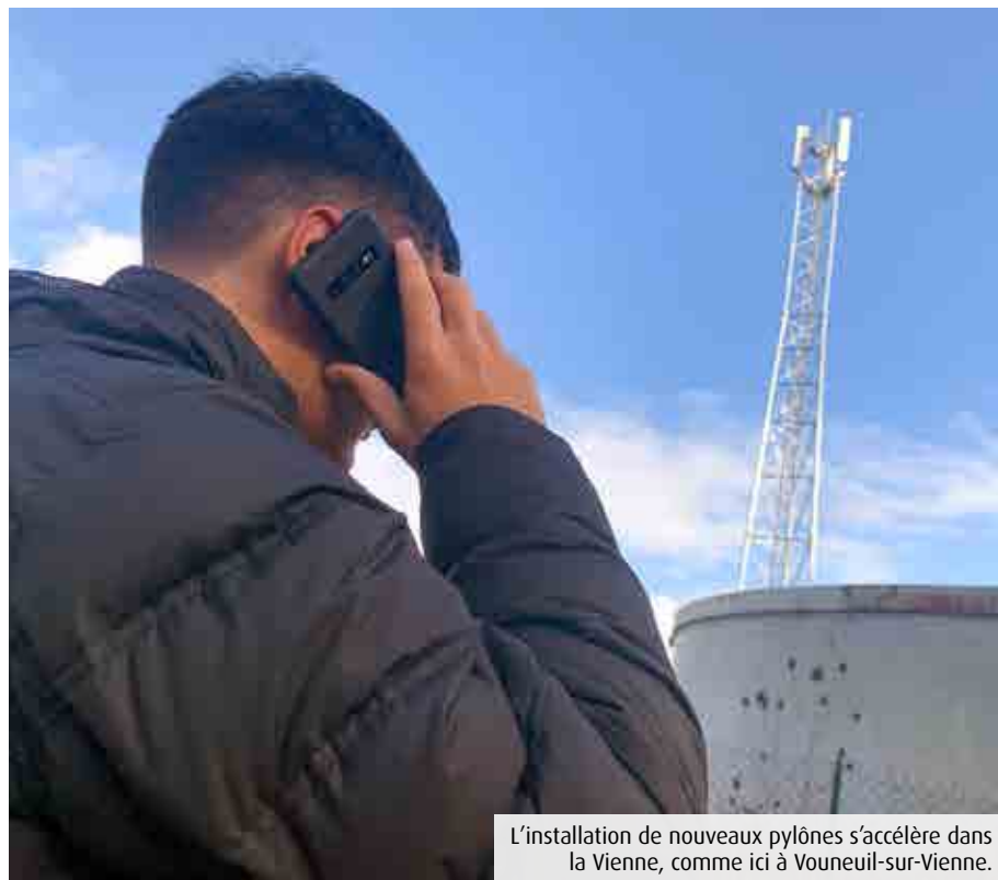
L'installation de nouveaux pylônes s'accélère dans la Vienne, comme ici à Vouneuil-sur-Vienne.

L'Etat indique en effet que dix-huit nouveaux pylônes ont été activés depuis cet été (*) , à Aulnay, Guesnes, Saint-Genest-d'Ambière, Boivre-la-Val-lée, Genouillé ou Moncontour. Le maire de la commune du Nord-Vienne affiche sa satisfaction de voir une troisième antenne s'ériger à Saint-Chartes, à 7km du bourg. « Cela concerne