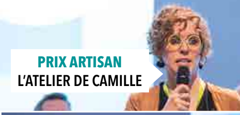
PRIX ARTISAN L'ATELIER DE CAMILLE