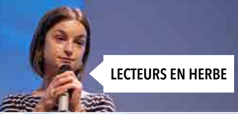
LECTEURS EN HERBE