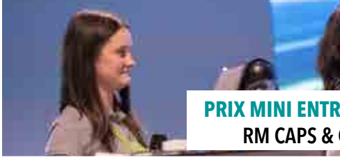
PRIX MINI ENTREPRISE RM CAPS & CO

Félicitations à l'ensemble des finalistes et aux grands vainqueurs d'avoir relevé le challenge, de présenter leur entreprise en moins de 5 minutes devant un jury de partenaires, administrateurs et représentants de la direction du Crédit Agricole de la Touraine et du Poitou.