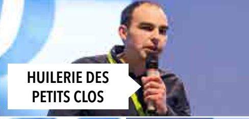
HUILERIE DES PETITS CLOS