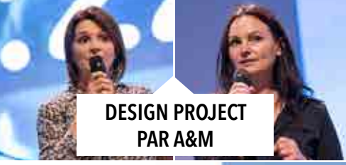
DESIGN PROJECT PAR A&M