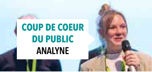
COUP DE COEUR DU PUBLIC ANALYNE