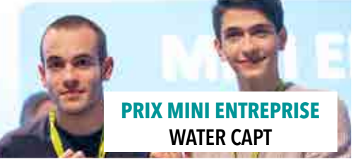
PRIX MINI ENTREPRISE WATER CAPT