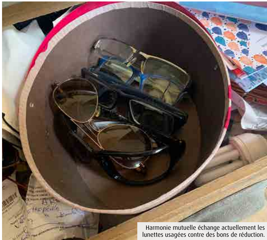
Harmonie mutuelle échange actuellement les lunettes usagées contre des bons de réduction.

Plateforme d'échanges En France, des millions de