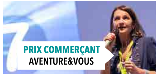
PRIX COMMERÇANT AVENTURE&VOUS

Rendez-vous en 2024 pour une nouvelle édition et la découverte de nouveaux talents de l'entreprenariat.